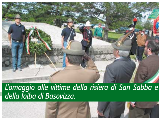
L'omaggio alle vittime della risiera di San Sabba e della foiba di Basovizza.