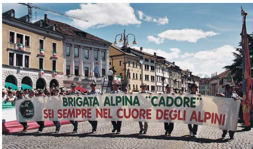
Lo striscione che ricorda la brigata Cadore, "per sempre nei nostri cuori".