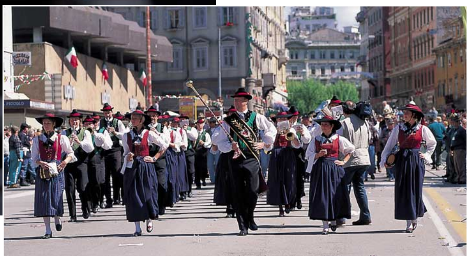
A destra: la bella formazione della Musikkapelle di Marengo (Bolzano) che ha riscosso un grande successo sfilando con la sezione dell'Alto Adige. Nelle altre immagini, momenti dell'Adunata.