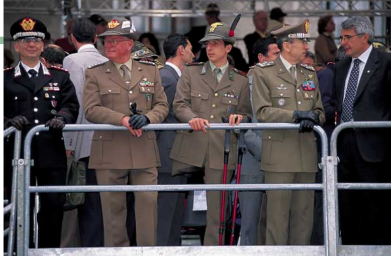
Il sottosegretario alla Difesa Berselli con Beppe Parazzini, il ministro Giovanardi e il vice presidente del Consiglio Fini sulla tribuna d'onore. A destra, il comandante interregionale dei carabinieri generale di Corpo d'Armata Roberto Santini; il ten. gen. Iob, il primo caporal maggiore Giannini, Medaglia d'Argento al Valor Civile (ha salvato la vita a una donna, rimanendo vittima d'un incidente stradale) in forza al 14° Rgt, btg. Vestone, e il capo di Stato Maggiore gen. Fraticelli.

doline in un sacrario all'aperto. Sembrava che finita la grande mattanza della Grande Guerra l'Italia potesse vivere in pace. Invece ci fu una seconda guerra, per molti versi ancora più crudele perché fu teatro di atrocità alle quali non sfuggirono – oltre che i soldati – anche migliaia di civili la cui colpa era di essere italiani: la foiba di Basovizza e la risiera di San Sabba sono luoghi tristemente passati alla storia, che hanno lasciato ferite ancora aperte.