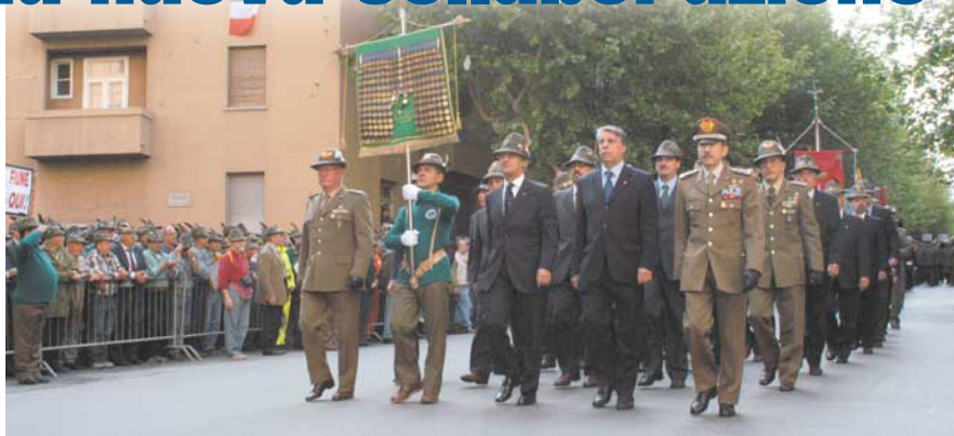
Da destra: il capo di Stato Maggiore gen. Giulio Fraticelli all'Adunata di Trieste mentre scorta il Labaro con il ministro Carlo Giovanardi, l'allora presidente Beppe Parazzini e il ten. generale Bruno Iob comandante delle Truppe alpine.

Il primo riguarda la conservazione e la valorizzazione del potenziale alpino dei ragazzi del Sud, che una volta congedati non trovano una realtà attiva che consenta loro di mantenere e trasmettere quello spirito di corpo che hanno acquisito, spesso in modo brillante, nei lunghi mesi di naja e che rischia di disperdersi. La proposta è di sensibilizzare i presidenti di sezione del quarto raggruppamento, di metterli in condizione di contattare i congedati e di programmare iniziative significative nel campo della solidarietà e della tradizione alpina, magari in